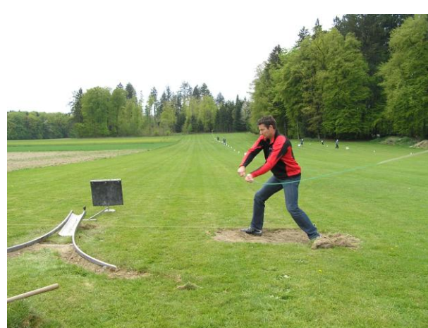
Am Dorfhornussen gibt es Aktivitäten für jeden Geschmack

Im Herbst werden gleich zwei Anlässe in Urtenen stattfinden. Am 2. Oktober treffen sich Mannschaften aus der Grauholzregion zum traditionellen Grauholzhornussen. Eine Woche später findet am 8./9. Oktober unser alljährliches Oktoberhornussen mitsamt Barbetrieb statt.